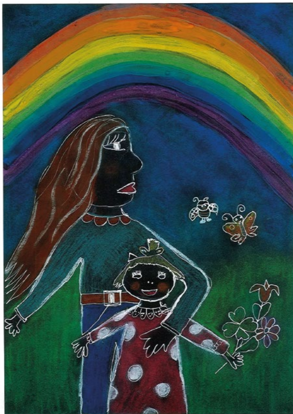
Herpay Zóra Réka, 6 éves: Abigél, életem legszebb ajándéka