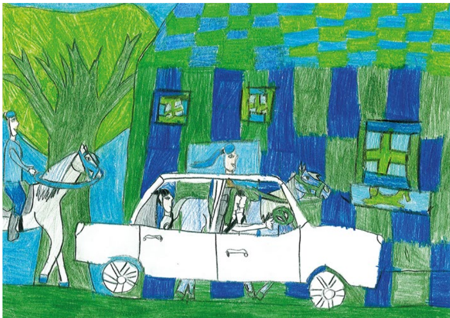
Rácz Bernadett, 3. osztályos: Családdal vagyok