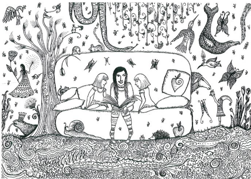
Raffay Boróka, 13 éves: Mesélek az ikreknek