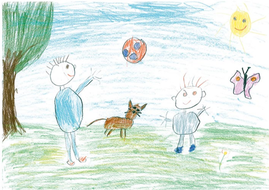
Győri Máttyás, 5 éves: Bátyóval labdázunk