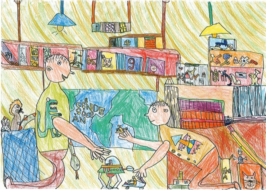
Szarka Dömötör, 7 éves: A testvérem és én