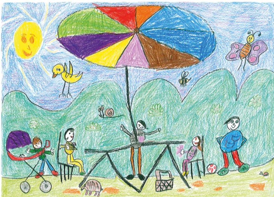
Bán Adrienn, 6 éves: Közösen piknikezünk