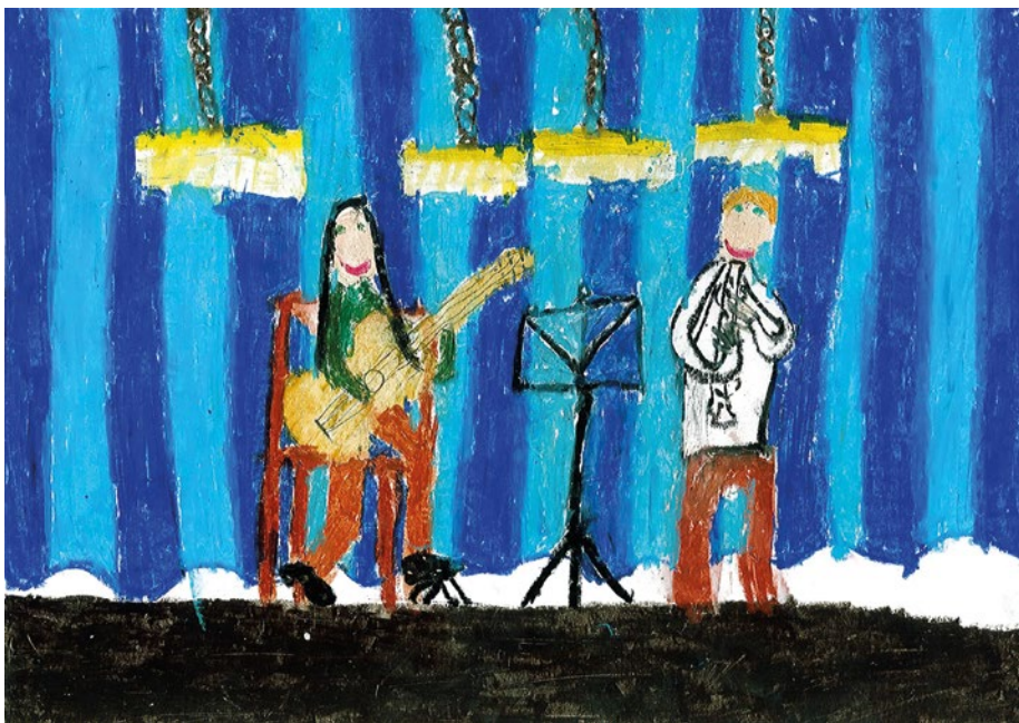
Raffay Ágoston, 8 éves: A nővéremmel kamarázunk